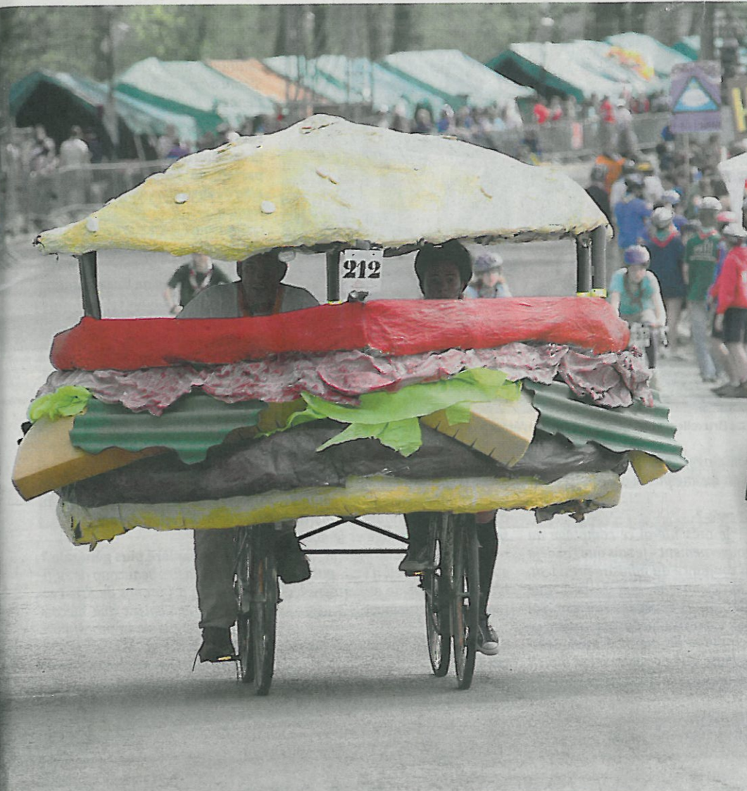
sont déroulées sous un soleil radieux. Hélas, les prévisions pour la nuit dernière étaient moins souriantes.